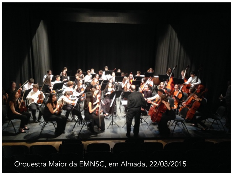
Orquestra Maior da EMNSC, em Almada, 22/03/2015